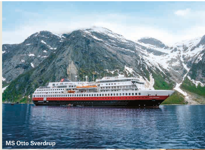
MS Otto Sverdrup

BRZ: 16.140 Länge: 135,75 Meter Breite: 21,5 Meter Geschwindigkeit: 15 Knoten