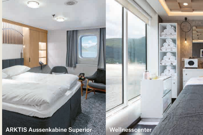
ARKTIS Aussenkabine Superior